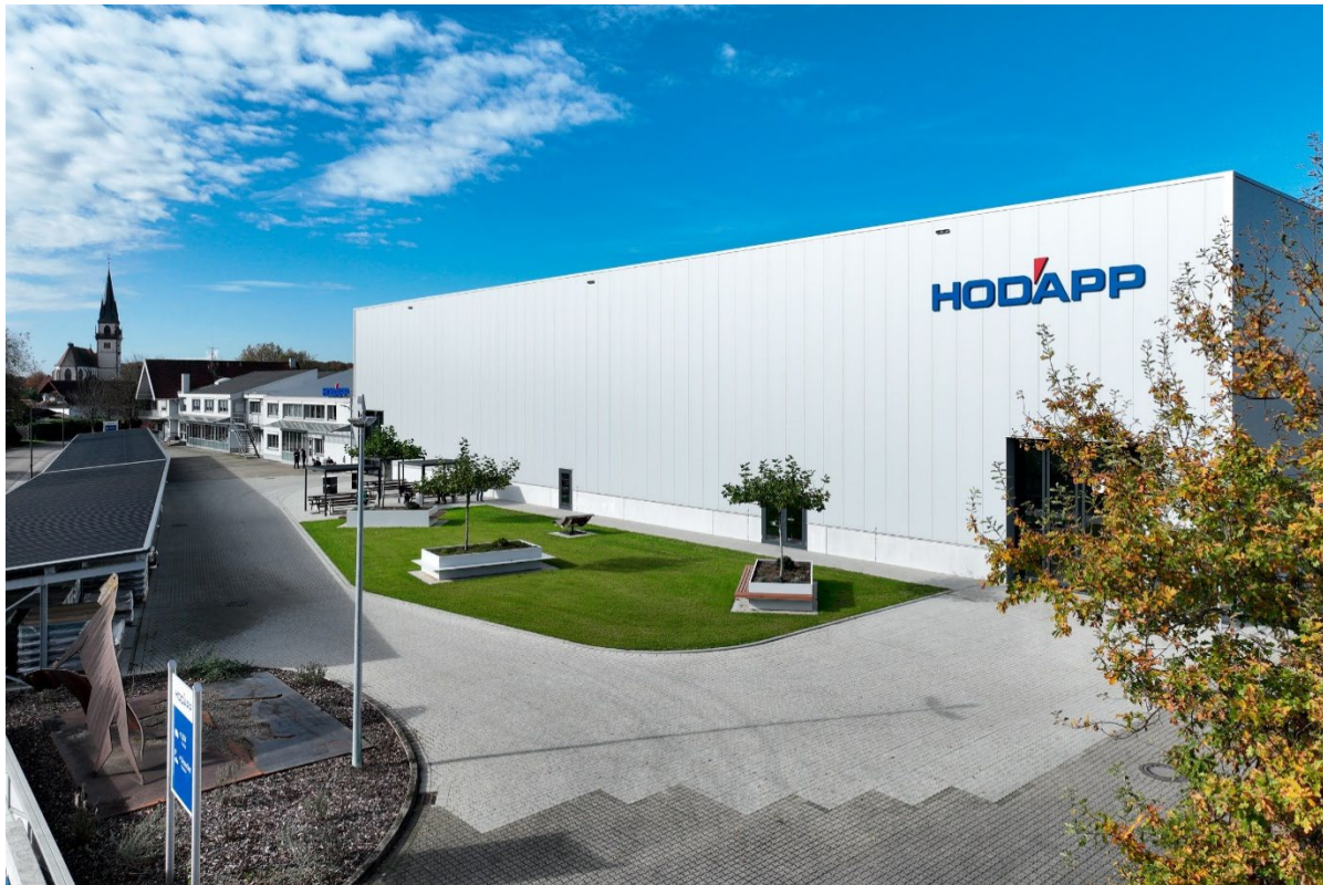
Bild 2: Der Firmensitz in Achern-Großweier der Hodapp GmbH & Co. KG

Seit über 75 Jahren entwickelt und produziert Hodapp in Achern, Baden-Württemberg, Spezialtüren und -tore aus Stahl und Edelstahl - und seit Kurzem auch aus Aluminium.